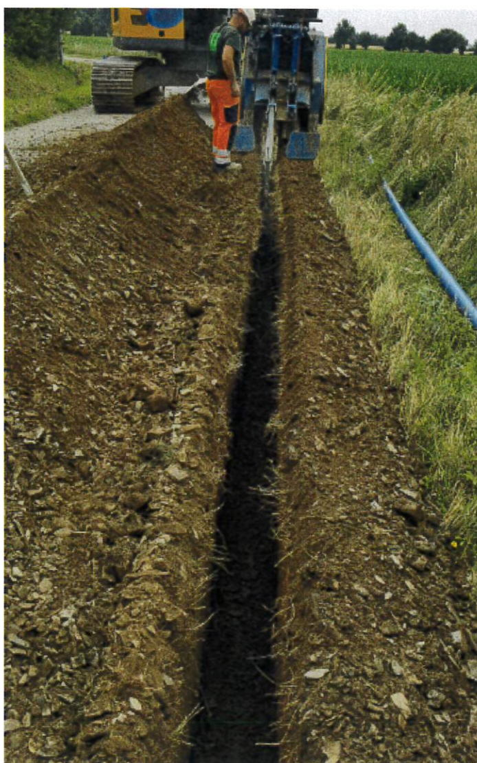
Pose de conduite AEP avec la trancheuse